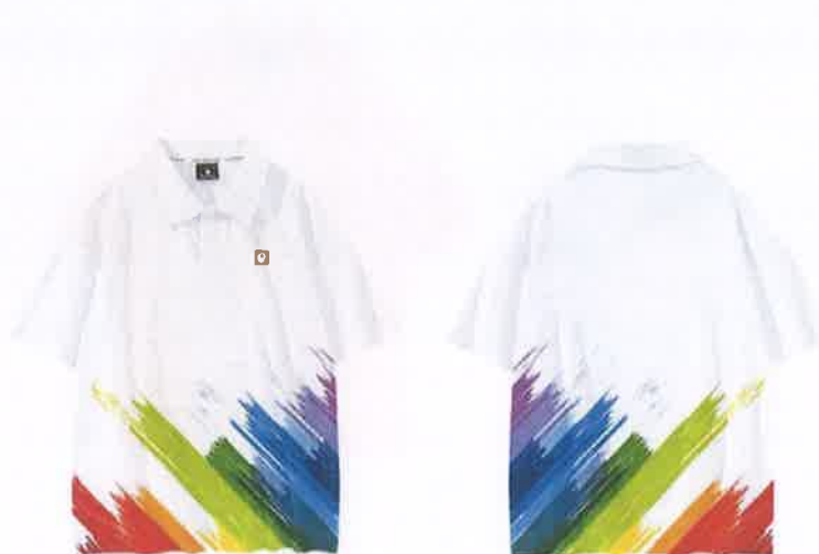
学生及领队服装样式