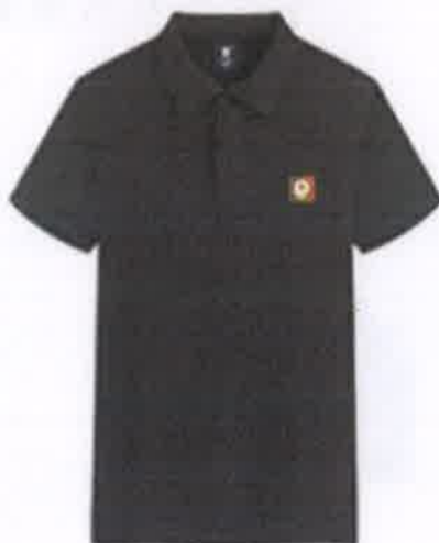
工作人员服装样式，颜色不同