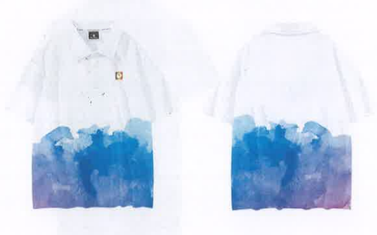
科技辅导员服装样式