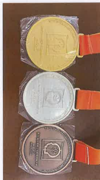
金银铜牌设计图及实物